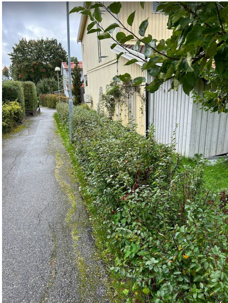
8. Oxbär, beskärs maxhöjd 100 cm