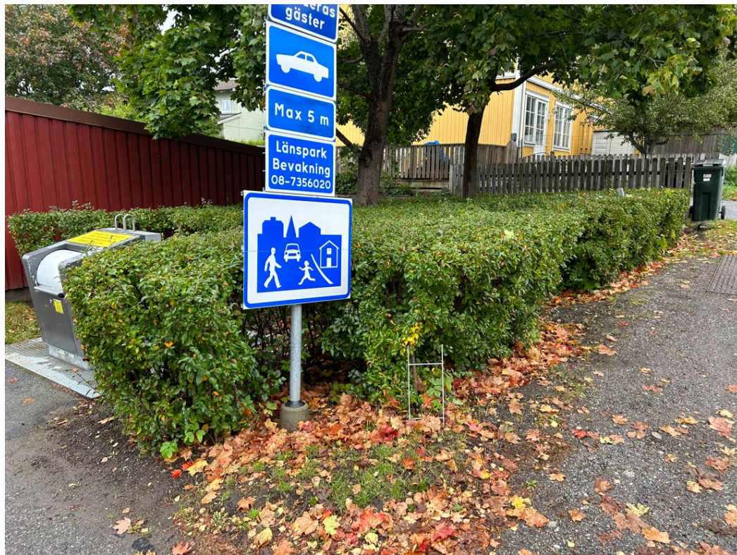
1. Oxbär, beskårs maxhöjd 100 cm