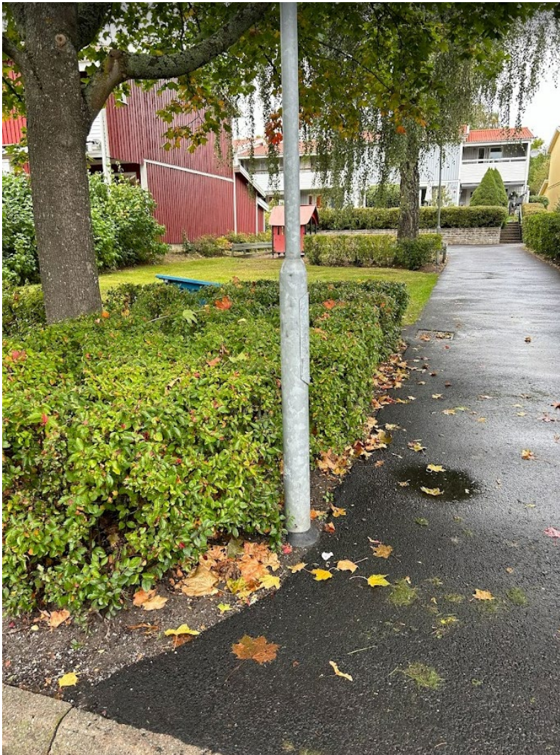
11. Oxbär, beskårs maxhöjd 80 cm