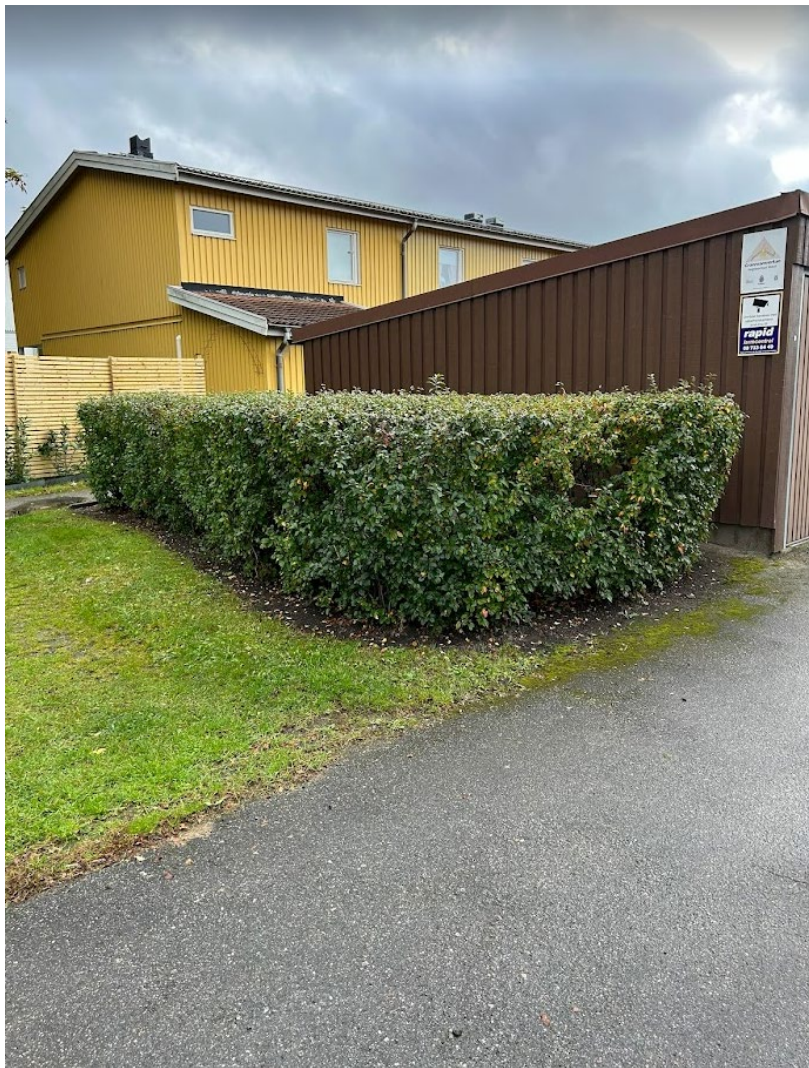
22. Oxbär beskärs maxhöjd 120 cm