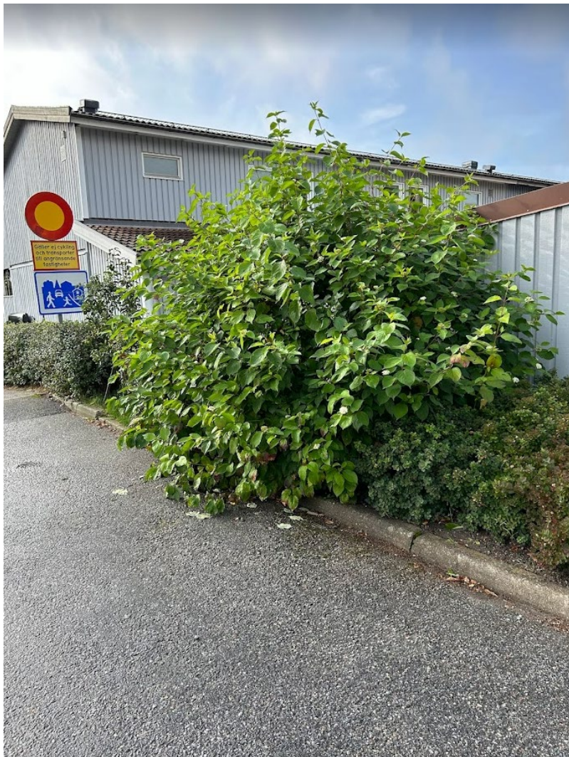
24. beskårs maxhöjd 200 cm samt fri från garagevägg