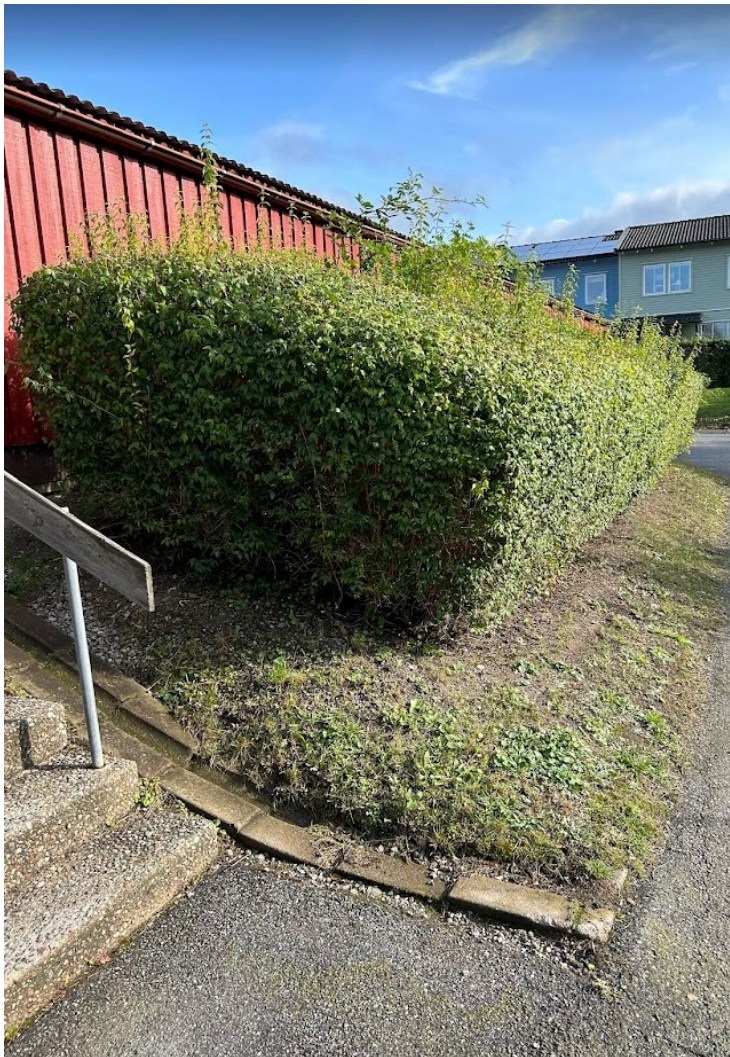
26. beskårs maxhöjd 120 cm