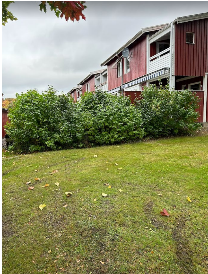
13. Syren, beskärs ej