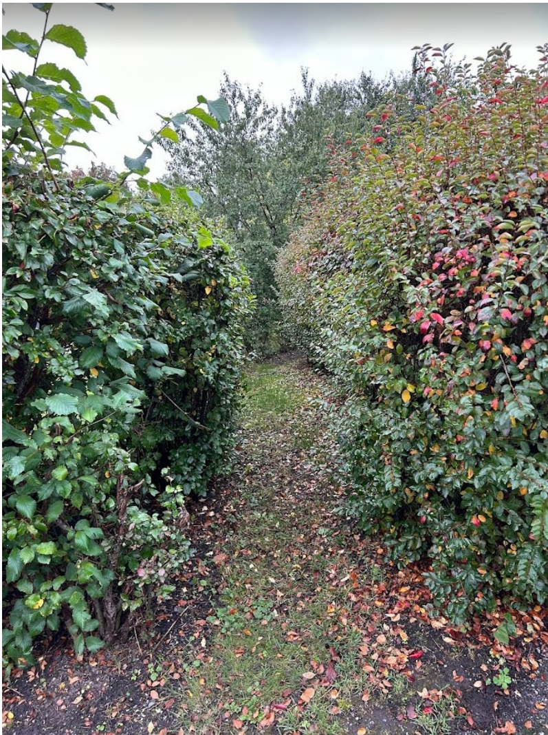
20. Gång klippes för framkomlighet