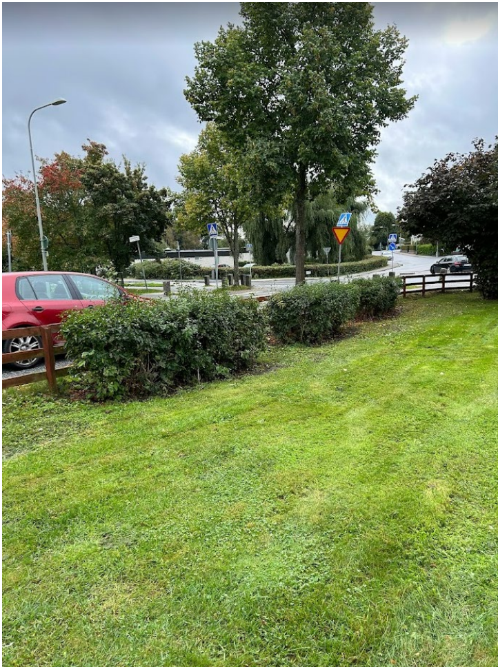
3. Jasmin, beskärs ej