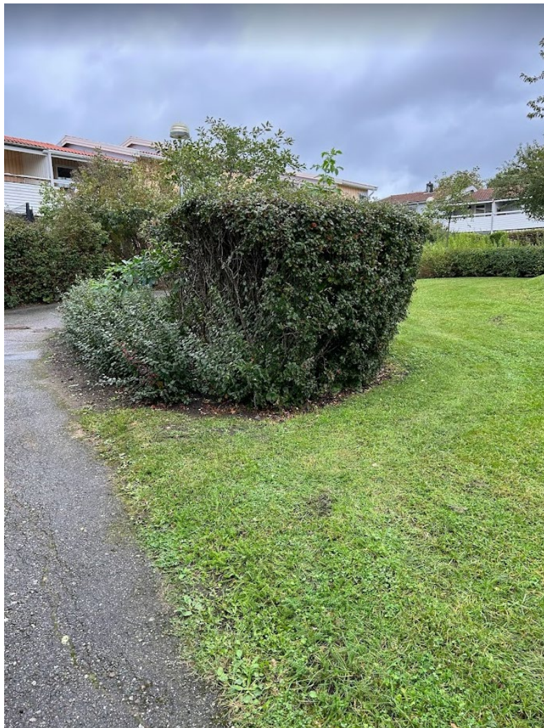
17. Oxbär beskär maxhöjd 100 cm